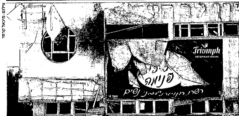
קניון לב הצפון בקריית שמונה לאחר פגיעת קטיושה במלחמת לבנון השנייה. בפעם הבאה זה יקרה בתל אביב

ז ביותר היה סר תומאס זמאה ה-15 ביוגרפיה פני ד. יש אומרים שכל הפ' ז למכביר. מלודי המוכר נקשת. למרות זאת, אצל ז זמן עד שהבינו שם שום