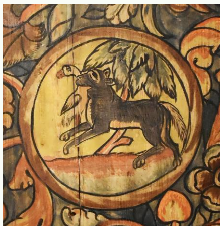
זאב טורף אווז, ציור קיר. אונטרלימפורג (גרמניה), בית הכנסת, התקרה, 1738-9. צילום: צבי אורגד, 2015.

הציורים הללו, האפרוח והגדי נחטפו מתוך ציבור גדול של חיות - תרנגולת עם אפרוחיה ועדר עיזים (בהתאמה), המביטים בחיית הטרף. בבית הכנסת של גבוז'דזייץ צוירו חמש סצנות של טריפת חיות בית, ובהן עז, אווזים וארנבות. 2 מוטיב מצויר נוסף אשר עשוי להתפרש כסצנה אכזרית הוא נשר דו ראשי האוחז בציפורניו שתי ארנבות – למשל על תקרת בית הכנסת בחודורוב (1714) ומעל ארון הקודש בבית הכנסת בסמוטריץ' שעוטר כנראה בשנת 1746.